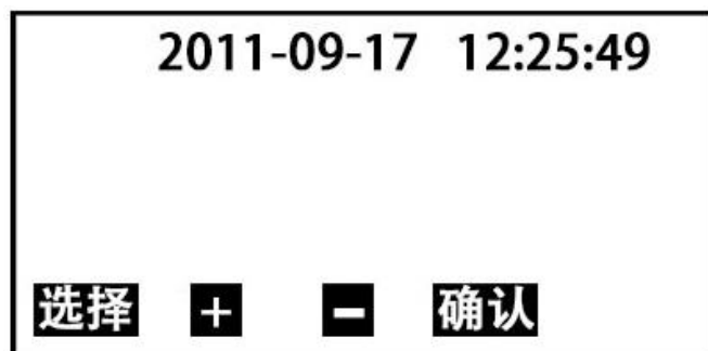
图5 时间设置子页面

按 选择 键移动光标—至年、月、日、时、分处，按 + 或 - 键选择具体数值后，按 确认 键确认，并返回开机页面；