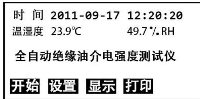
图 1 开机页面