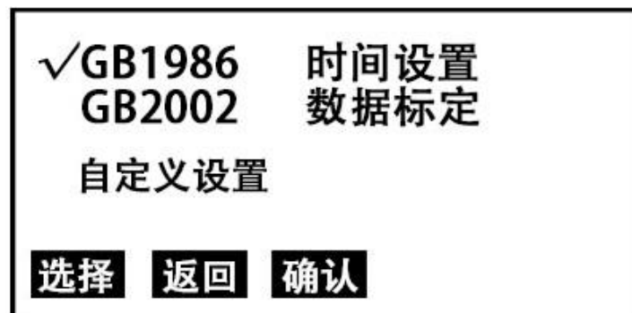
图 2 选择子页面