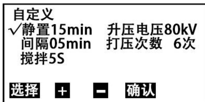
图6 自定义设置子页面

在图6页面下，按 选择 键移动光标到相应的选项，再按 + 或 - 键可进行相关参数的设置。其中：